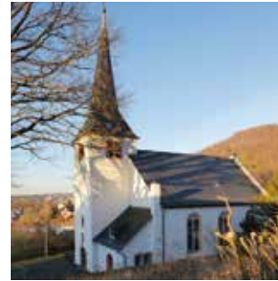
Ev. Bergkirche Jugenheim