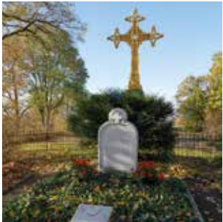
Grabstätte und Goldenes Kreuz