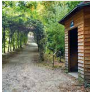
Laubengang und Rehhäuschen